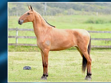
JÁ BRILHEI DO OH