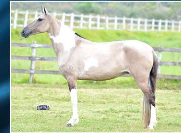
GILCA DO OH