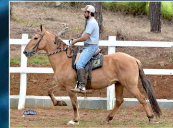
REQUINTE DE SANTA MARGARIDA