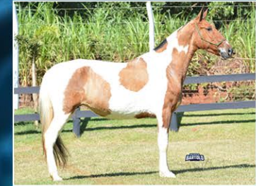
BARISTA DO WALARA