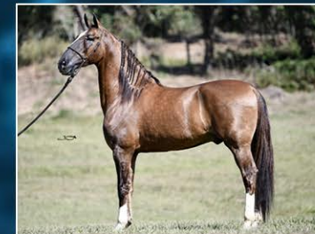
SEU PAI TELECO DE SÃO JOÃO