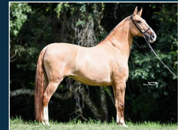
SUA MÃE IVYNA DA JAD

Linda !!! Linda !!! Linda!!! Me desculpe as feias mais beleza é fundamental, potra altiva bem angulada, filha do Grande Campeão Vatel de São João na Campeoníssima Ivyna da Jad.