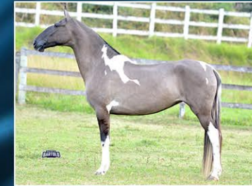
OSTENTAÇÃO DO SEGREDO