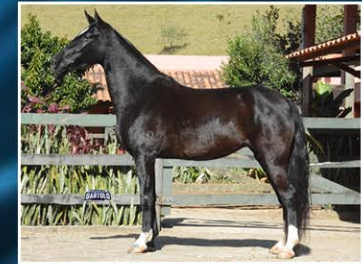
DÁDIVA D' TAL