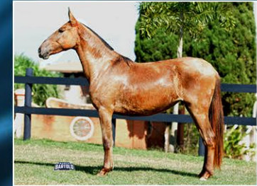
GAIA DO JAR