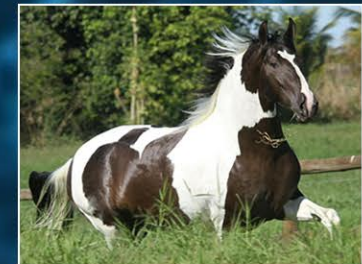
SEU PAI OUSADO DO BARULHO