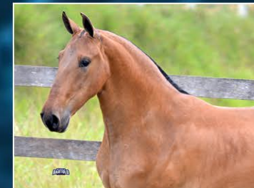
MAIS QUE DEMAIS DO OH