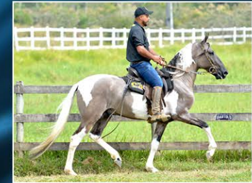
JURAMENTO DO OH