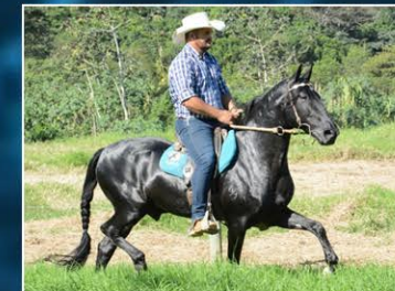
SEU PAI RINGO J.G.O.