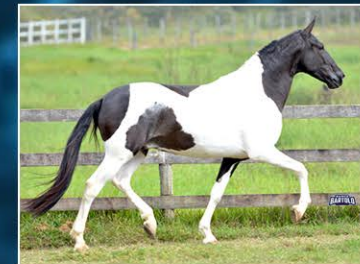
PAGODE DO RIO GRANDE