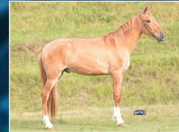
LET'S GO DO OH