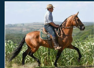
SEU PAI EMBLEMA DA TERRA NOVA

Égua nova de grande qualidade genética dos melhores animais na história da Campolina (Geodo, Viação, Kamaro, Santa Maria, Portento, Olinda) se existe genealogia premiada, esta tem de sobra Ferrari do JAR.