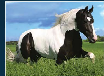
SEU AVÔ GAVIÃO DO BARULHO

Encontro de genética de campeões, sendo ambos os pais Campeões Nacionais. Linda, nova, Lobuna pampa, com estrutura corporal e angulações diferenciadas. Para quem quer apostar na beleza do Campolina em um animal dócil e inteligente.