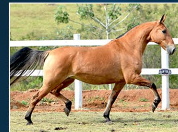
SUA MÃE MONIFA DA HIBIPEBA

Fruto do acasalamento estrategicamente pensado. A junção da tradição com a modernidade de Campeões Nacionais muito bons de sela. Mãe, Livro de Elite da Raça e o pai, Bicampeão Nacional. Potro inteligente que nos surpreende a cada dia.