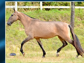
CACHAÇA DO PARAISO