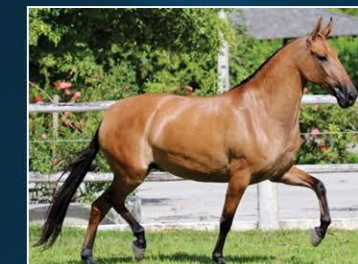
SUA MÃE GATA DO ANAITÍ

Raça, docilidade e marcha de qualidade. Jovem potro de marcha picada que carrega no seu sangue o DNA da marcha tanto na linha alta como na linha baixa, filho de Campeões Nacionais. Ferrabrás do Haras Ventania Grande Campeão da Raça em 2017 e, Gata do Anaití Campeã Nacional 2018 Cabeça, Raça e Categoria. Barba, cabelo e bigode.