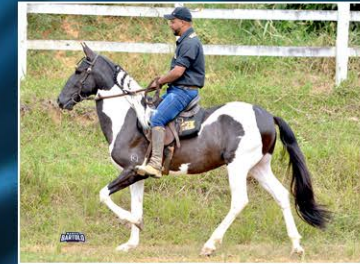
PAGODE DO RIO GRANDE