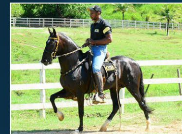
PRENHEZ POR APOLO J.G.O.

Irmã da Jeta do Segredo, irmã do garanhão Ouro Negro do Barulho, irmã do Jack Daniels do Segredo. Simplesmente filha do Hirço do Barulho, que tem em suas veias Estalo do Pantaleão, garanhão ícone que dentre suas atribuições produziu Gavião do Barulho. Pelagem lobuna pampa e sua beleza marcante, andamento marchado, uma pintura de raça e marcha, deixa na reserva do Haras um embrião pronto e vai com prenhez por Apolo J.G.O.