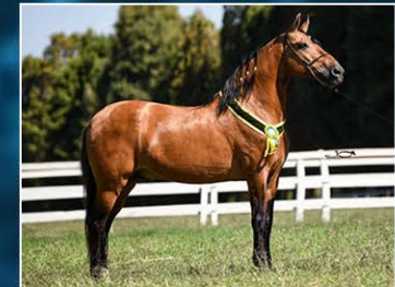
SEU PAI JOGO DA SERRA CAMPINA