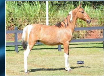
ITHAIBAN DO JAR