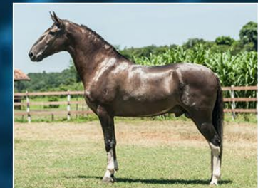
SEU PAI DESTROYER DO STO ANTÔNIO