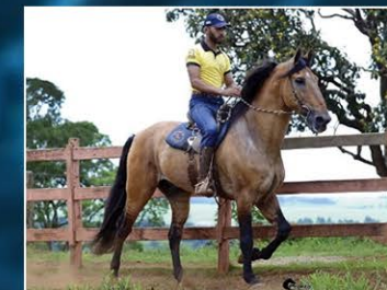
SEU PAI SAMURAY DA DONA FLOR