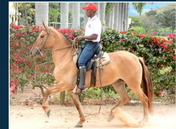
SUA MÃE XIQUITITA DE SÃO JUDAS

Potra diferenciada pela sua genética de puro andar e resultado de pista, ainda em início de doma demonstra todo seu potencial. Alquimia no acasalamento do Jogo da Serra da Campina na Xiquitita de São Judas.