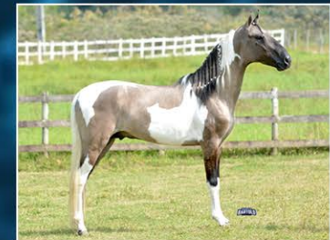
JURAMENTO DO OH