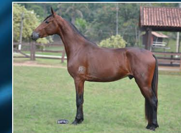
KIBON DO HARAS VENTANIA