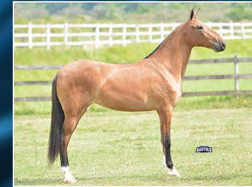
MAIS QUE DEMAIS DO OH