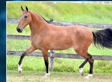
SUA FILHA MAIS QUE DEMAIS DO OH