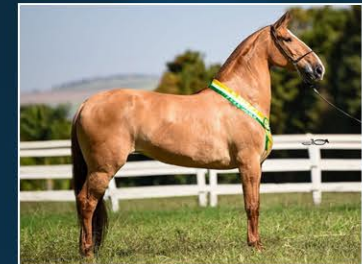
SUA MÃE TÂMARA DE SÃO JOÃO

Uma potranca com futuro muito promissor, filha do campeoníssimo Jogo da Serra da Campina sua mãe Tâmara de São João também já consagrada nas pistas doadora de confiança no plantel JAR.