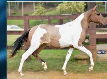
MISS DO HARAS VENTANIA