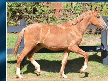
HÉLIO DO JAR