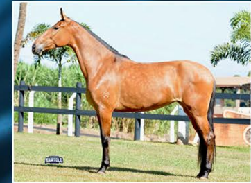
FRANCISCA DO JAR