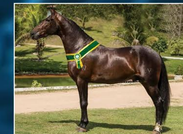
SEU PAI FERRABRÁS DO HARAS VENTANIA