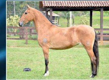
LUDMILLA DO HARAS VENTANIA