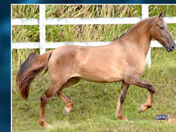
CHARLOTTE DO GC