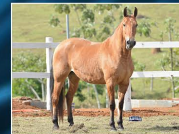
MONIFA DA HIBIPEBA