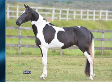
IMAGEM DO OH