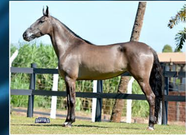
FERRARI DO JAR