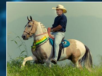
SEU PAI QUEBRA-NOZES DO BARULHO