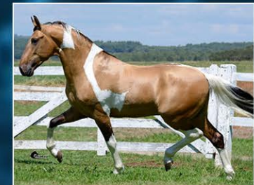
SEU PAI HIGHLANDER DO STO ANTÔNIO