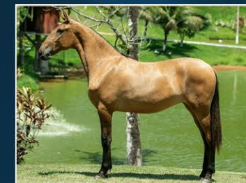
SUA MÃE ÍISIS DO HARAS VENTANIA

Padrões que vão vindo e indo a contemplar, o padrão de sua beleza, que a todos fazem desejar. Assim é Miss do Haras Ventania uma filha de (Quebra-Nozes do Barulho x Íisis do Haras Ventania) Sua mãe em 2019 foi Reservada Campeã em Barbacena e Itaipava, Campeoníssima na 9ª Brasileira do Cavalinho Campolina. Seu pai dispensa apresentações, simplesmente ele Quebra-Nozes do Barulho 2017 e 2018 ganhou tudo. Nobreza de ancestralidade com bela pelagem.