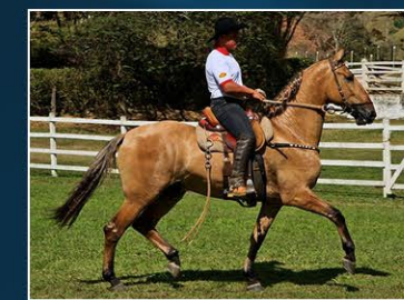
SEU AVÔ MOLEQUE DE SAO JUDAS

Pista! Pista! Pista! Doadora de embriões, investimento certo, essa aqui prova que Genética de Campeões são os melhores, filha de Xazan do Atalho, atual Grande Campeão Nacional na Para Tudo do Boomerang, que é Lancaster do Barulho em Relíquia do M.M; enfim, esta é para ir direto em pistas e embriões, sempre neste projeto trazemos a oferta dos melhores, está aí a prova, inédita com três anos e pronta para levar seu currículo ao topo.