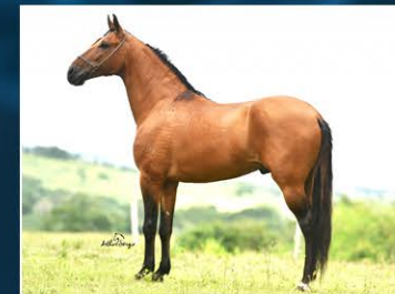
SEU PAI GUARIBA DO DESTINO

Filho do "Guaribão", isso mesmo, além disso irmão próprio de Neymar do Destino, marcha picada pura. Já completando seus 36 meses direto para as pistas e produção, este é para produzir marcha picada de excelência, investimento com retorno certo.