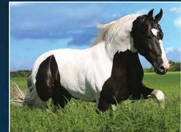
SEU AVÔ GAVIÃO DO BARULHO

Pampa de lobuno, lindo, expressivo, manso de sela. Sangue do mais alto nível da Raça Campolina, Lorde da Mima, Induto São Judas, Ventania, Pantaleão, Gavião do Barulho. Deixou matrizes cobertas no Haras OH, novo ganhão para pistas e reprodução, mais um exemplar digno do Genética de Campeões.