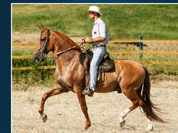
SEU PAI FARAÓ DA HIBIPEBA

Comprovada como indivíduo, marcha e raça, e também na sua prole. São 9 campeonatos nacionais. Esta eternizada na história da Raça Campolina, inscrita no Livro de Elite da Raça (número 18). A família Canto Verde busca um sócio para propulsionar esta genética vencedora. Detalhe importante é que a Mônifa recentemente participou de uma das grandes cavalgadas de nossa Raça na Fazenda Águas Claras em Visconde de Mauá / RJ, dentre outras.