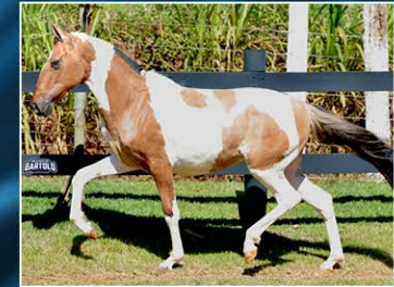
IVYNA DO JAR