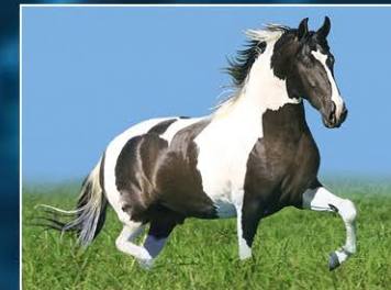
SEU PAI OUSADO DO BARULHO