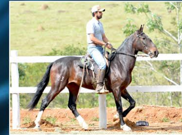
ASTRAL DO CANTO VERDE