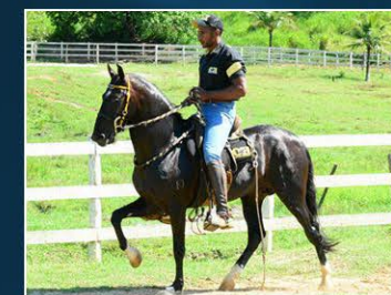
PRENHEZ POR APOLO J.G.O.

Filha do destaque da raça, produtor de Grandes Campeões, com produção invejável no Rancho do Sobrado, Dona Flor, Camparal e Haras das Plumas. Está aí uma doadora de pelagem exótica, com raça e marcha. Segue com prenhez do campeoníssimo Nacional Apolo J.G.O. com previsão de parto Dezembro 2023.