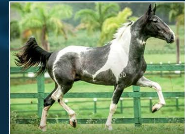
SEU PAI SERTÃO DO L.P.D.

Marcha Picada, Pampa, Campeã. Andamento genuíno, macio, temperamento de sela. Dissociação é seu sobrenome.