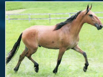
SEU PAI LORD DE SÃO JUDAS

Castrado de Sela para quem é exigente. Bom de marcha, bom de sela e inteligente. Comprovado nas pistas como Campeão Nacional e Brasileiro no ano de 2021, ficando em primeiro lugar, sempre, nas provas funcionais da nossa Raça. Também, comprovado como cavalo de confiança para todo o tipo de Cavalgada feita pela família Canto Verde.