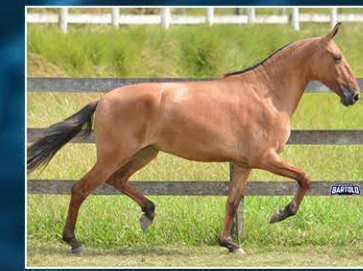
JÁ BRILHEI DO OH