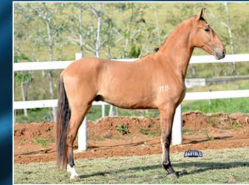
CHRONOS DO CANTO VERDE