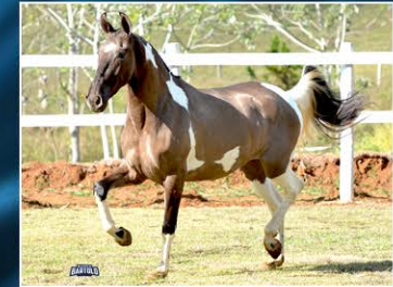
BARONESA DO CANTO VERDE