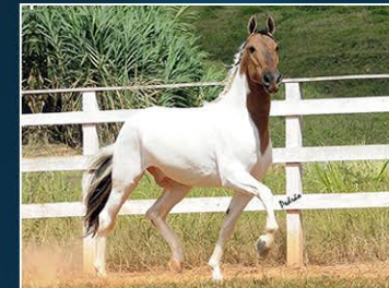
SEU AVÔ MONARCA DE SÃO JOÃO

Castrado de sela. Animal novo e pronto para cavalgar. Pelagem exótica, excelente porte e índole ideal. Estrutura corporal em desenvolvimento e que já chama atenção nas cavalgadas. Filho de um dos grandes reprodutores da Raça na atualidade e Grande Campeão nas pistas. Sua mãe possui temperamento e montada excepcional.