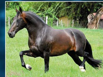
SEU PAI JOALHEIRO DO RM