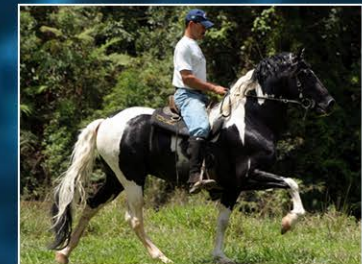
SEU PAI LÍRIO D' TAL