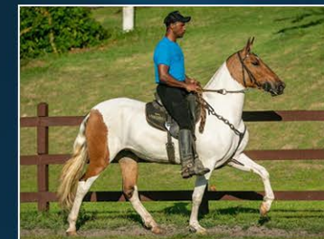
SUA MÃE GUITARRA DO HARAS VENTANIA

Filha de Ringo J.G.O. (Gênio do Pantaleão x Axé J.G.O.) ganhão este de pelagem negra. Na égua Guitarra do Haras Ventania (Best-Seller do Haras Ventania x Kalunga do Barulho). Sua mãe Reservada Campeã Brasileira, já seu pai nada mais nada menos que Ringo J.G.O. - o Grande Campeão nas mais pesadas exposições da raça e ainda Campeão Nacional Progenie de Pai. Ludimilla carrega em suas veias os melhores indivíduos da raça campolina moderna. Potra moderna, raçuda, expressiva e marchadora, ainda se não bastasse tem a chancela Ventania.