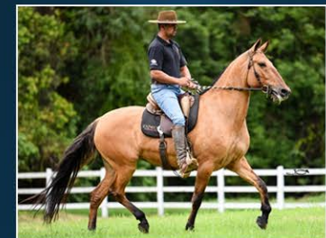
SUA MÃE JÓIA RARA DA JAD

Potro de grande futuro que cabe na prateleira de cima de qualquer criatório, filho do Grande Marchador Highlander do Santo Antônio sua mãe Joia Rara da Jad "Ana Laura do Lancaster". Olha essa genética, marcha, marcha e marcha. O vendedor reserva 10 coberturas.