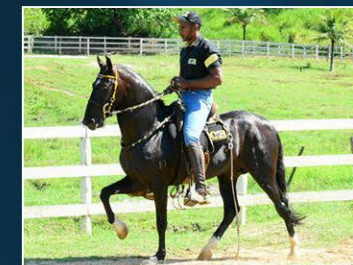
PRENHEZ POR APOLO J.G.O.

Filha do Samuray da Dona Flor, que produziu campeões no Haras Dona Flor e Camparal. Sangue de marcha Dona Flor, Campolina moderno, essa doadora produziu reserva com Curió do Sertão e deixa no Haras OH embrião com Curió e Thomaz do Barulho. Prenhez por Apolo J.G.O.