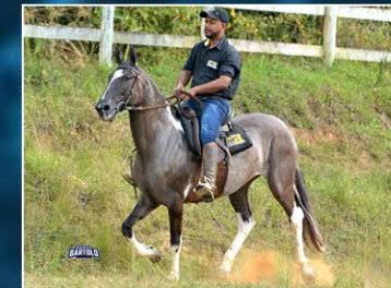
OSTENTAÇÃO DO SEGREDO