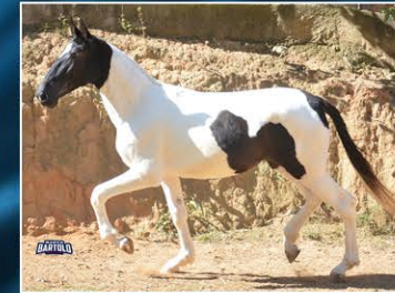
HERANÇA D' TAL