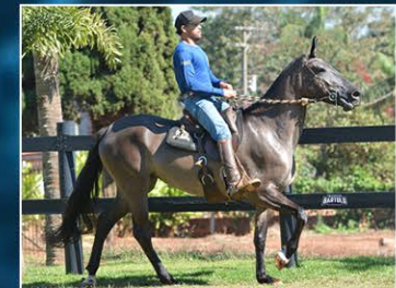
FERRARI DO JAR