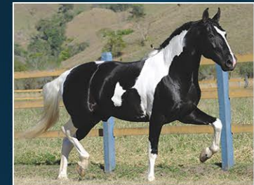
PRENHEZ POR QUINDIM D' TAL

Genética nobre com Ivanhoé do Chaparral, É Top, Feiticeiro de Santa Rita / Ousado de Passa Tempo. Seu pai, Lírio D'Tal, foi Multicampeão Nacional tanto na ABCC quanto na ABCPampa. É de pelagem negra, marcha natural e pura de picada, e vai com prenhez de 24/04/2023 do Grande Campeão Quindim D'Tal, sempre primeiro de marcha e morfologia em todas as exposições que participou, tanto na ABCCC quanto na ABCPampa. Oportunidade única.