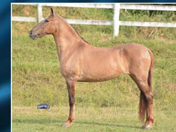
CHARLOTTE DO GC