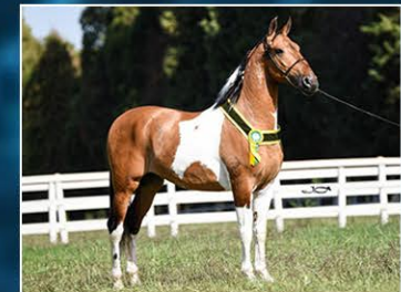
SEU PAI VATEL DE SÃO JOÃO