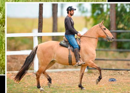
XANTIA DO R.N.

Campeã Nacional Égua Égua Adulta Marcha Batida 43° Exposição Nacional do Cavalo Campolina 2023. Campeã de Morfologia Égua Júnior Maior Marcha Batida 41° Exposição Nacional do Cavalo Campolina 2021. Reservada Campeã Égua Júnior Maior 41° Exposição Nacional do Cavalo Campolina 2021. Reservada Campeã Convencional na 4ª ExpoJacarei / 100ª Estadual da Raça Campolina do Estado de São Paulo 2021. Grande da Raça na 10ª Exposição Brasileira do Cavalo Campolina de Casimiro de Abreu-RJ 2021.