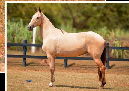
VIK DE SÃO JOÃO