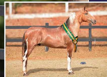
SEU FILHO INVICTO DO JAR