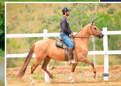
SUA FILHA BELA DO CANTO VERDE