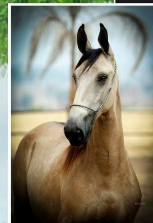
QUINTO DE SANTA ANNA