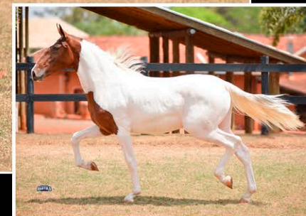
JOHNNIE WALKER DO JAR