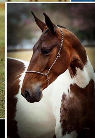
MOLINARA DE SANTA ANNA

Segue com prenhez de Merlot de Santa Anna com parto previsto para: 28/10/2024.