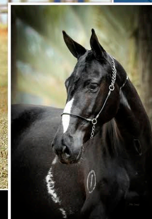
NASSAU DE SANTA ANNA

Segue com prenhez de Rei das Marias com parto previsto para: 19/11/2024.