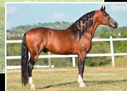
CURIÓ DO SERTÃO

Segue com prenhez de Curió do Sertão com parto previsto para: 03/02/2025.