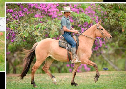
LIRA DO MODELO