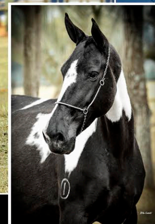
GRADUADA DE SANTA ANNA

Segue com prenhez do homozigoto Ouro Negro de Santa Anna com parto previsto para: 05/01/2025.