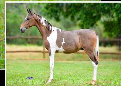
NAIPE DO CHIRIBIRIBINHA