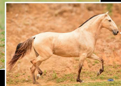
XIQUITA DE SÃO JUDAS