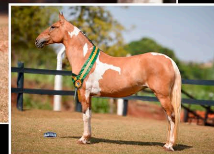
DENDECA DO JAR

Campeã de Marcha Brasileira Égua Jovem Jacareí-SP. Res. Campeã Categoria Égua Jovem. Res. Grande Marchadeira Brasileira Jacareí-SP. Res. Campeã de Marcha Itaipava-RJ. Res. Campeã Categoria Itaipava-RJ.