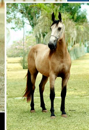
QUINTO DE SANTA ANNA