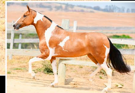
LUA NEGRA GALÁCTICA