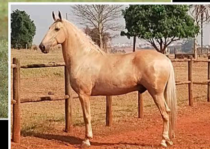
MALBORO DE SANTA ANNA

Segue com prenhez de Malboro de Santa Anna com parto previsto para: 26/03/2025.